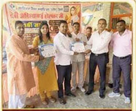
सम्मान पत्र एवं शील्ड प्रदान करते हुए