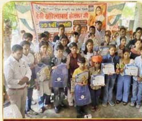
सम्मानित छात्र-छात्राओं के साथ गणमान्यजन