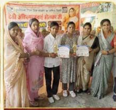
मेधावी छात्राओं को सम्मानित करते हुए