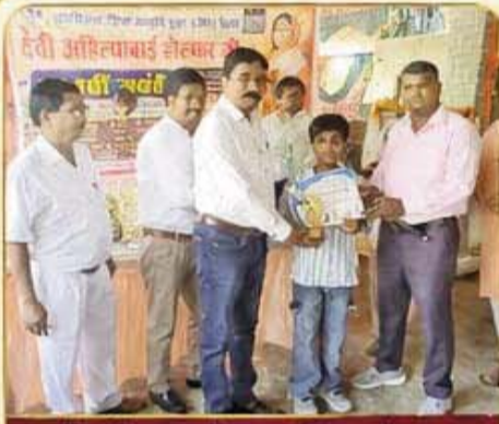
मेधावी छात्र को सम्मानित करते हुए